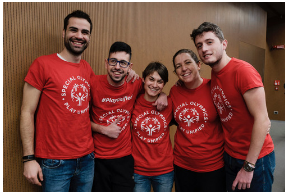
Atleti e partner che partiranno per Abu Dhabi