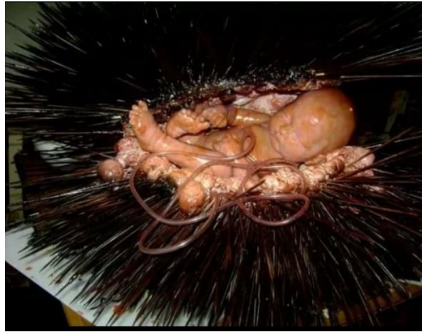
Echinoderma, legno, silicone vernice 100x100x100cm