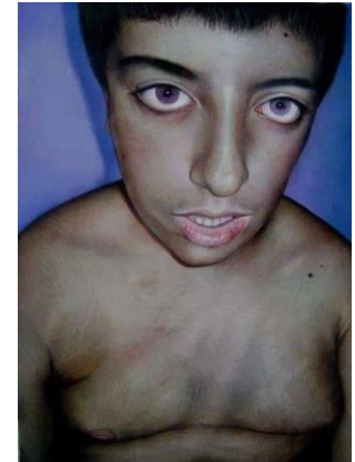
Bimbo dagli occhi di ametista, acrilico su tela 50X70cm