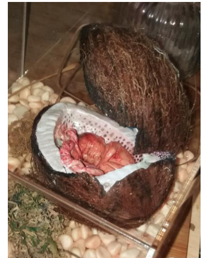
Cocos Nucifera ,Das ,30X30X30 cm