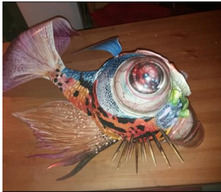
'Pesce Telescopio' DAS e materiali misti 40x100x50cm