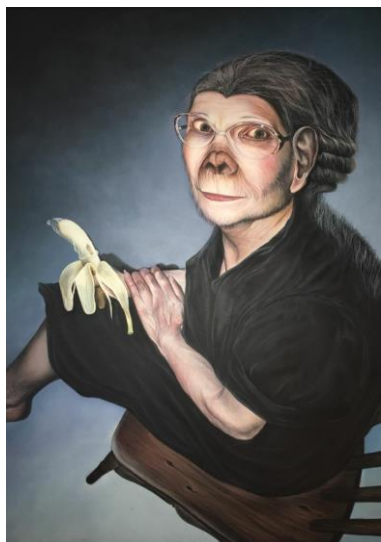
Ipotesi sull'evoluzione della specie ,90x130cm

LE OPERE SARANNO IN ESPOSIZIONE DAL 02 AL 10 GIUGNO 2018 PRESSO RSA ANNI AZZURRI SAN ROCCO VIA MONVISO 87 SEGRATE APERTO AL PUBBLICO