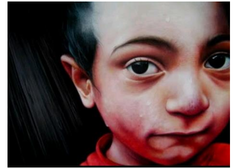
Nei suoi occhi l'autunno ,acrilico su tela 50x 70cm