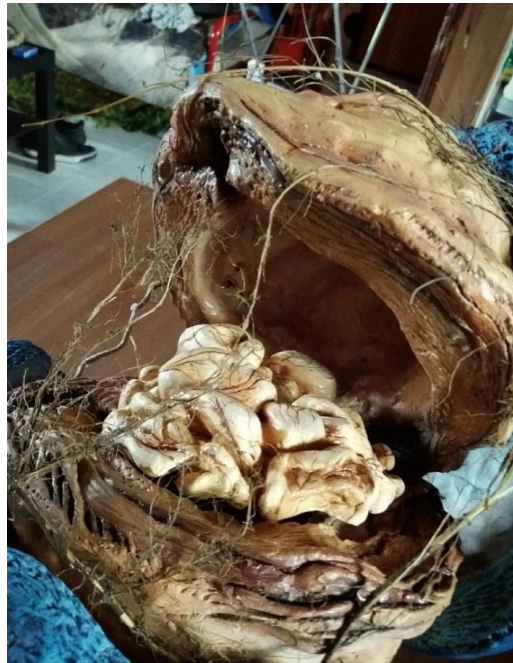
Organismo biologico Extraterrestre, das 60X60X60cm